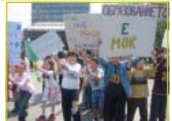
450 деца и нивните наставници маршираа на градскиот плоштад

беше и Анџелина Џоли . И Македонија беше дел од оваа глобална кампања. Кампањата започна со марш на Градскиот Плоштад. Благодарение на Акцент Медиа , 10