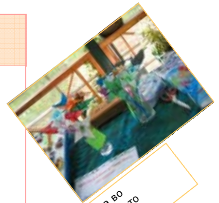
Распродажбата во Интернационалното Училиште QSI

навистина голема, со продажба на нашите украсни магнети и оригами цветови оствариме приход од 3.400 денари. Она што ќе ни остане во сејќавање одличениот настан е прекрсаната атмосферата и соработката која ја започнавме со училиштето QSI.