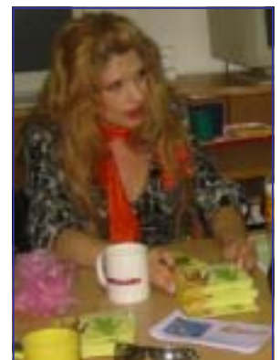
ЦД за сите младинци вклучени во проектот.. Со автограм, нормално.

јазичи, обука за кулинарски вештини, оснажнување и охрабрување за самостоен живот, лобирање и застапување и директни психосоцијални советувања. Во рамките на