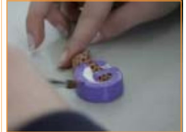
Сите фигури рачно се изработуваат

Во моментот, рачната изработка на фигурите се одвива навистина бавно, но, од септември изработката на фигури ќе биде вклучена како редовен проект во програмата на гимназијата НОВА.