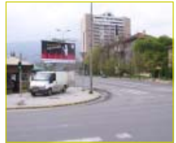
Еден од десетте билборди-донација од Акцент Медиа