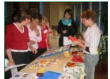
Голема заинтересираност за нашата Амбасада

Во меѓувреме, некои од членовите веќе ја посетија нашата Амбасада и беа наши гости.