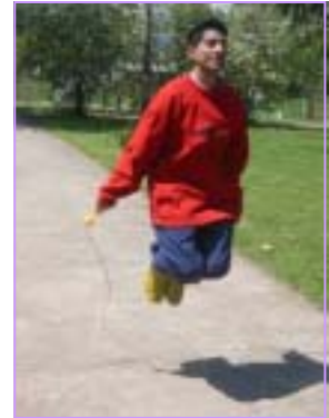
Забава за време на паузите

се сензибилизирани за работилничко работење на семинари. Освен вежбите предвидени со работниот план, со групата го поминувавме и слободното време. Се шетавме покрај Преспанското езеро за време на попладневните паузи, во вечерните часови игравме игри и се забавуваме со музика и пеење. Од 16. до 18. јуни во Охрид се одржа семинар за социјално учење со што младинците се стекнаа со поглема свесност за тоа какви улоги најчесто завземаат во интеракција со другите.